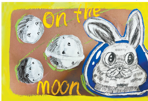
月亮上的兔子 平马路小学三(5)班 方心怡