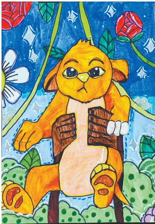
狮子王 新程街小学三(4)班 段梦云