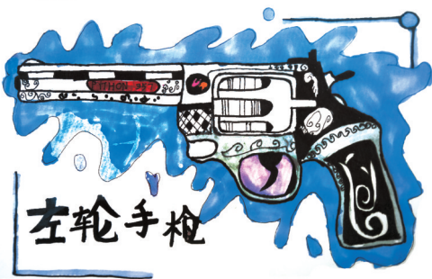
左轮手枪 南环路小学四(3)班 丁梦彤