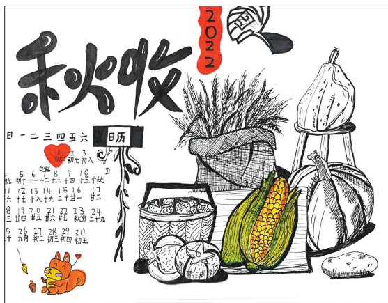
秋收 体育路小学二(6)班 杨子懿