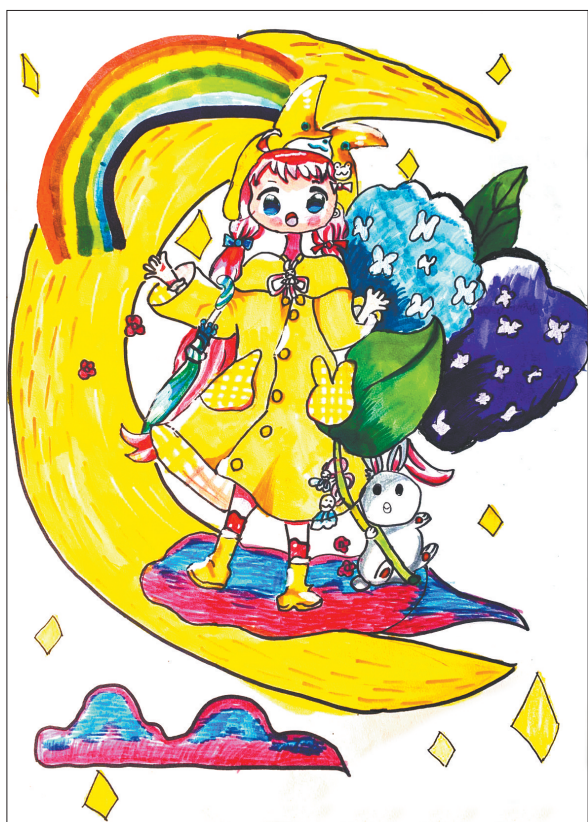
中秋节快乐 体育路小学四(4)班 吴昀轩