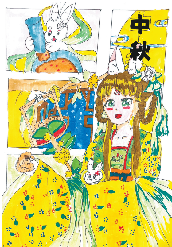
中秋 体育路小学四(7)班 付安吉