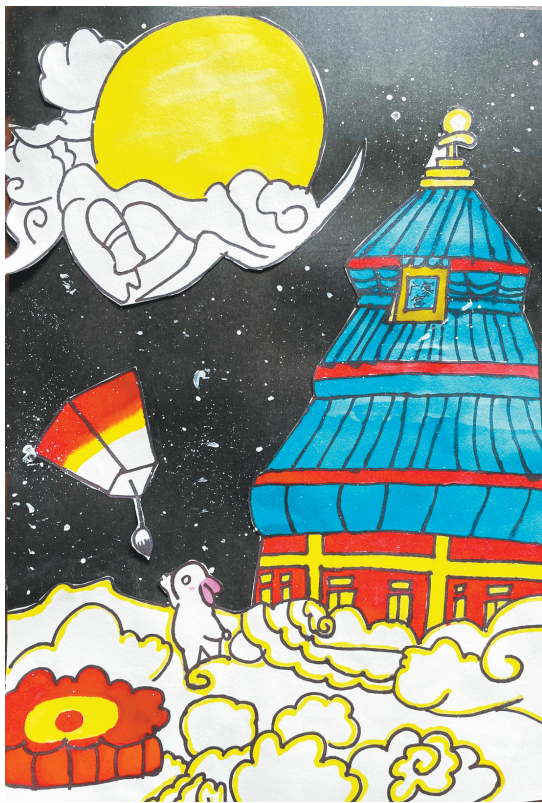
中秋 姚孟小学四(2)班 张梓茉 (指导老师：陈国赛)