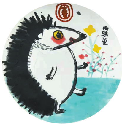
刺猬 东环路小学三(3)班 杨骥萱