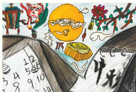
月华感秋 雷锋小学二(6)班 聂睿辰