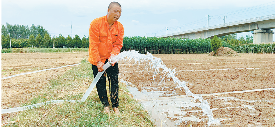
8月23日,在鲁山县张良镇福林村,一名村民在抗旱浇地。