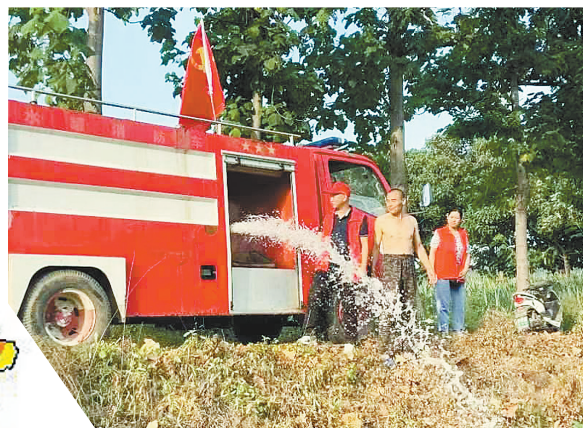
消防车向安良镇送水浇地