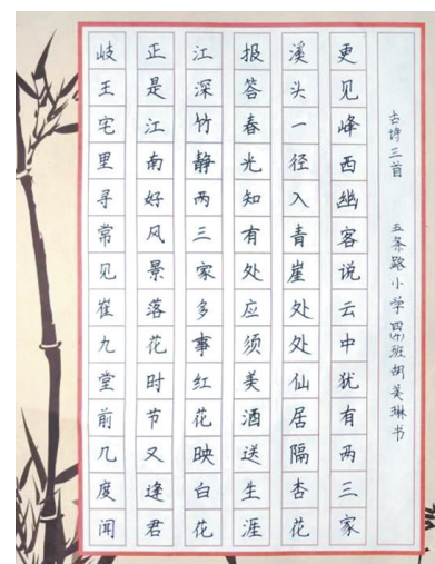
书法作品 五条路小学四(4)班 胡美琳