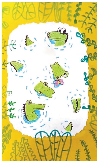
小鳄鱼 新新街小学二(1)班 程靖涵