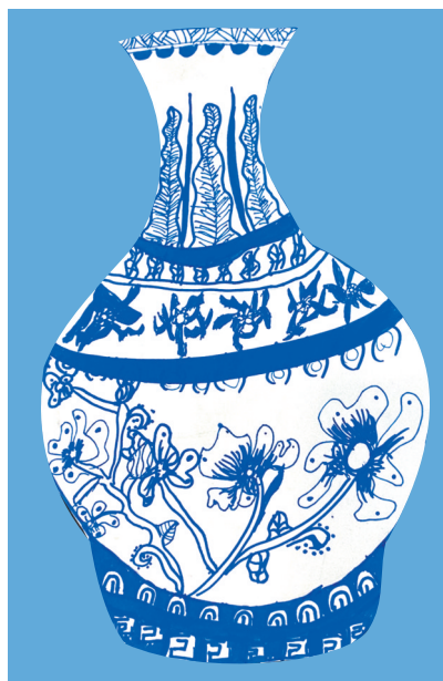
陶瓷 韦伦双语学校三(3)班 李圆莹