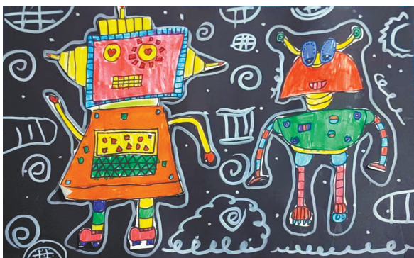
机器人 东环路小学二(3)班 翟小婧