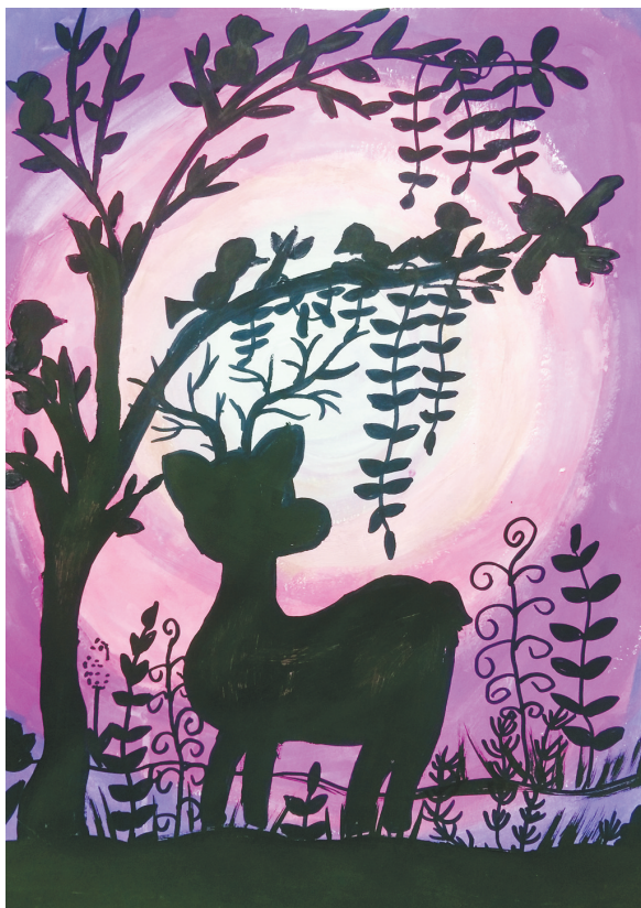
夜幕下的森林 新华区实验小学二(1)班 李宗果