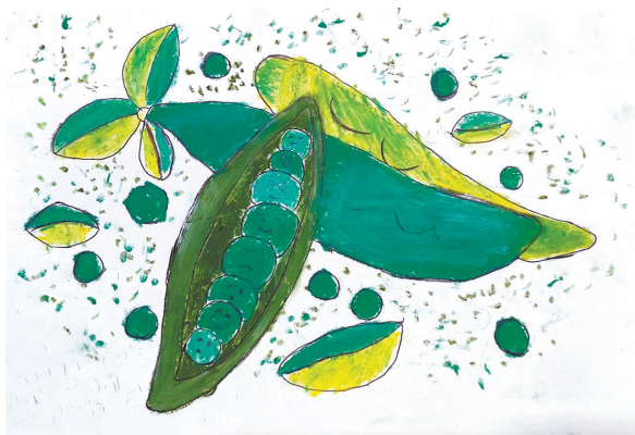
豌豆丰收 东环路小学四(4)班 王子琪