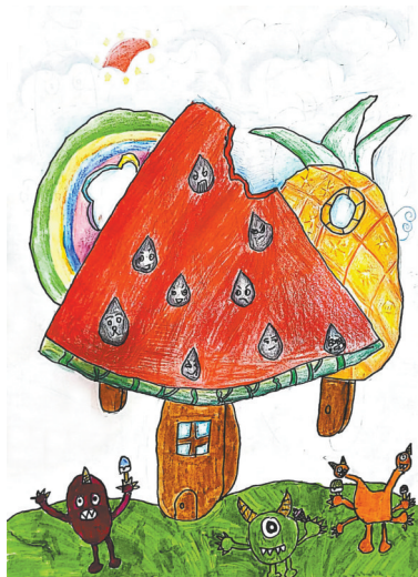
冰淇淋城堡 中心路小学二(4)班 王镜齐