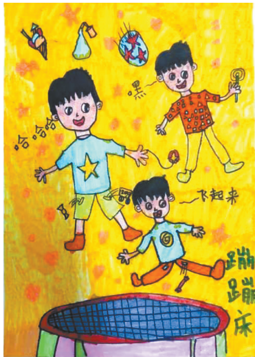
蹦蹦床 湛河区实验小学一(10)班 朱景泽