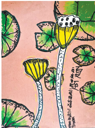
夏趣 南环路小学一(5)班 李宜霖