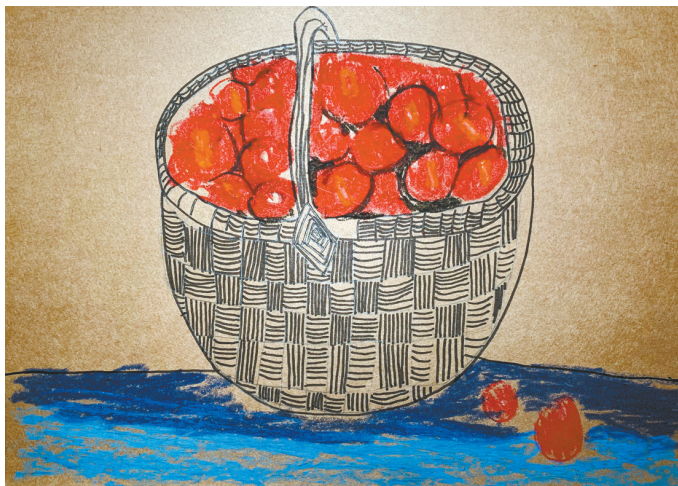
车厘子 平马路小学一(3)班 李原野