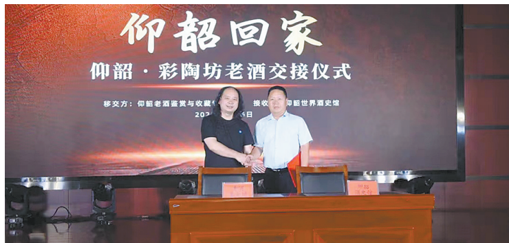
老酒交接仪式现场