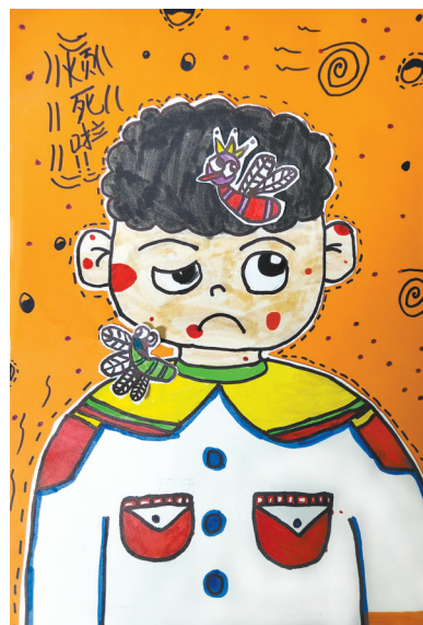
夏日的烦恼 一(1)班 杨冰夏