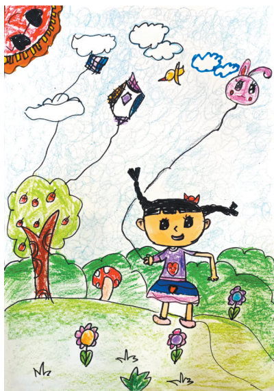
快乐的小女孩 一(1)班 吴子怡