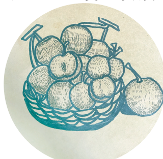
山楂 二(5)班 周新越