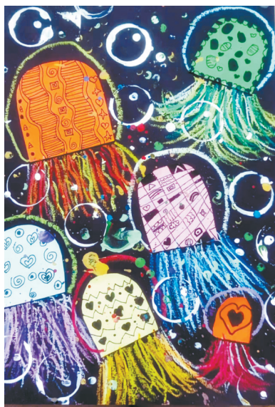
水母 二(1)班 侯怡彤