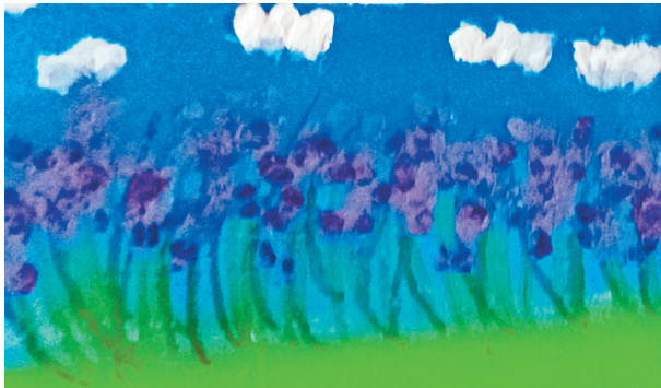
薰衣草 湛河区实验小学四(1)班 高于雅