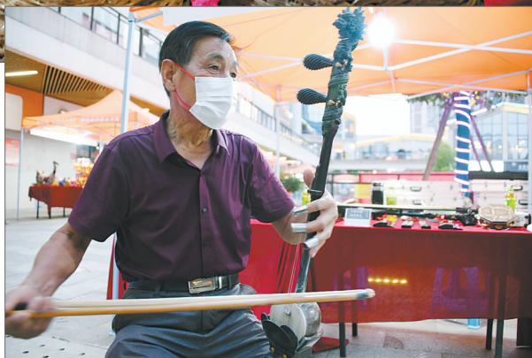
现场演奏非遗乐器