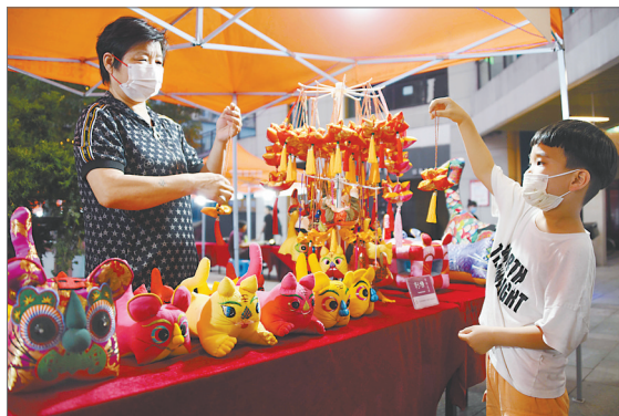
孩子被非遗产品刺绣香包吸引