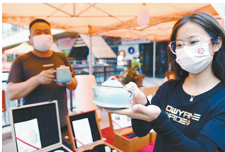
汝瓷茶壶吸引女孩