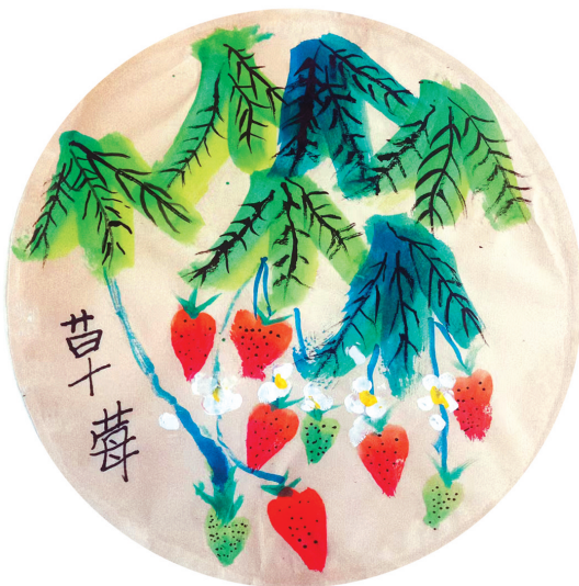
草莓 体育路小学二(7)班 郭原明 (指导老师:丁亚丽)