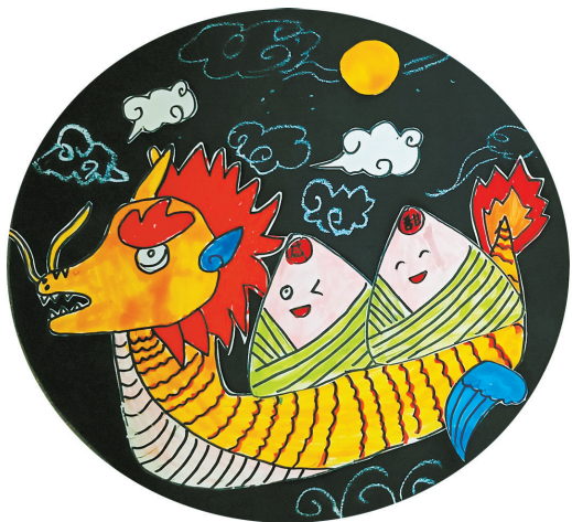
龙舟 胜利街小学二(7)班 郭桐赫