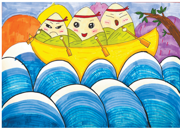
端午 东风路小学一(1)班 徐熙然