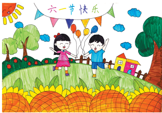
六一节快乐 新程街小学一(4)班 陈珍珠