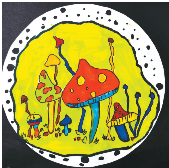
快乐的蘑菇 南环路小学一(5)班 李宜霖