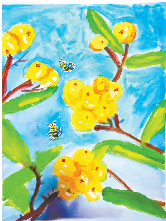
金灿灿的枇杷 建设街小学一(4)班 王沐奕