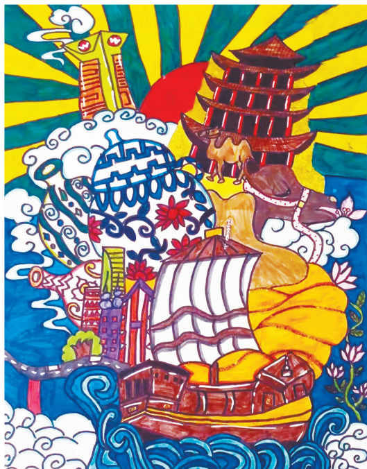
新华区实验小学四(5)班 沈士炜 指导老师:王素玲