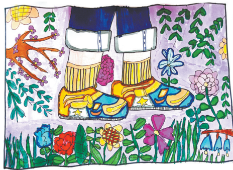
美丽的花园 三(3)班 张力元