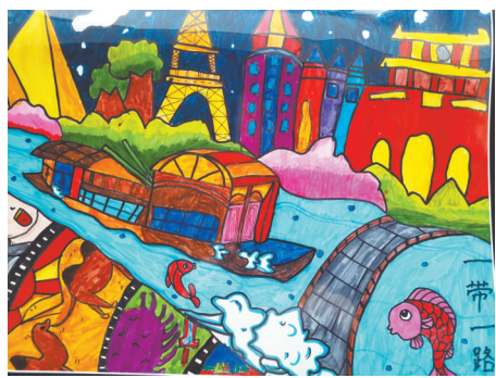
一带一路 二(6)班 赵国瑞