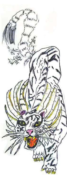
猛虎咆哮 一(2)班 张诗莹