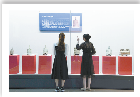
西周卷云纹铜甬钟