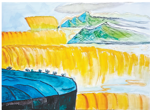
黄河 福佑路小学五(3)班 李智枫