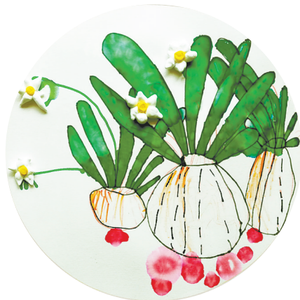
水仙花 翠林蓝湾小学二(3)班 刘家希