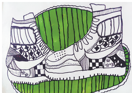
鞋子 卫东区实验小学三(6)班 盛译莹