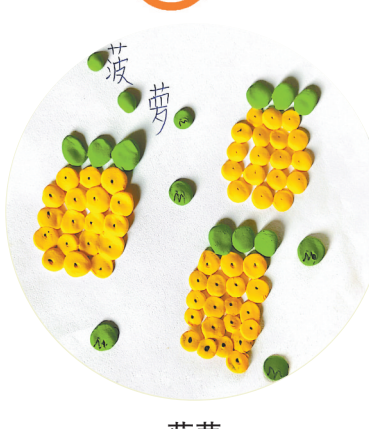
菠萝 万和小学二(2)班 赵艺