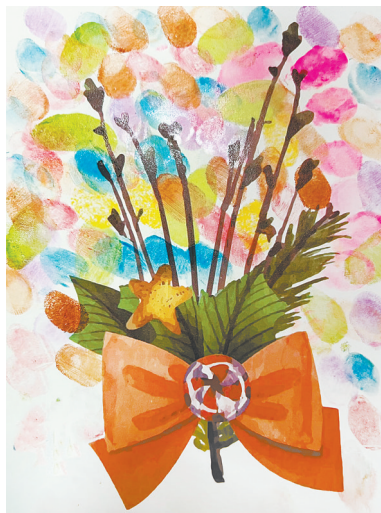
一束鲜花 中心路小学二(3)班 姜莱