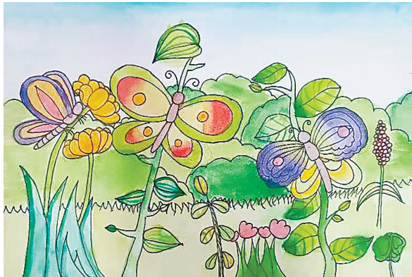
雨林蝴蝶 南环路小学二(3)班 巨嘉彤