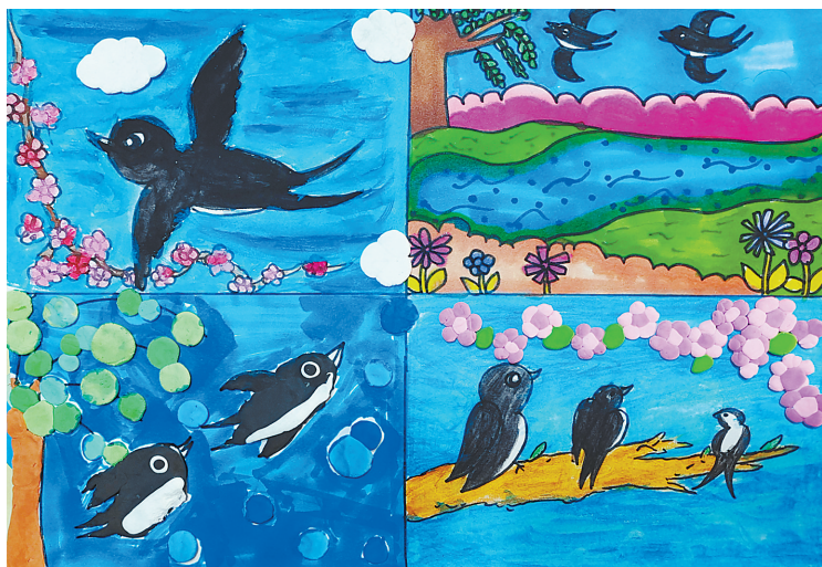
燕子 梅园路小学三(3)班 樊雅文