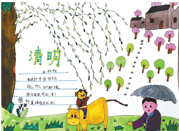
清明 体育路小学一(5)班 马钰晴