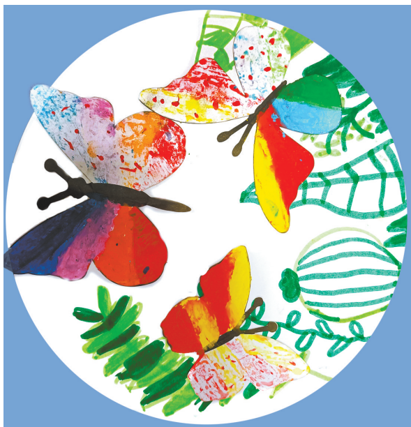
彩蝶 东风路小学一(1)班 李桐欣（指导老师：潘明丽）