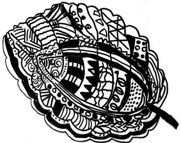
树叶 开源路小学四(2)班 李明倩（指导老师：李会玲）