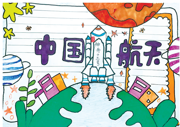
飞向太空 翠林蓝湾小学二(2)班 张珂颖