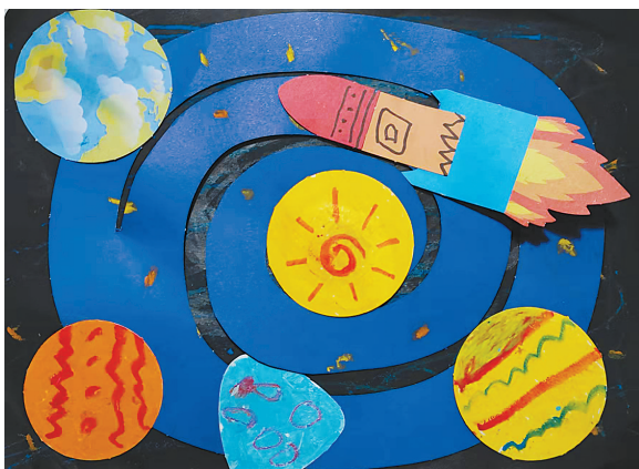
宇宙星系 公明路小学二(2)班 王黎昕 (指导老师:张艳姣)