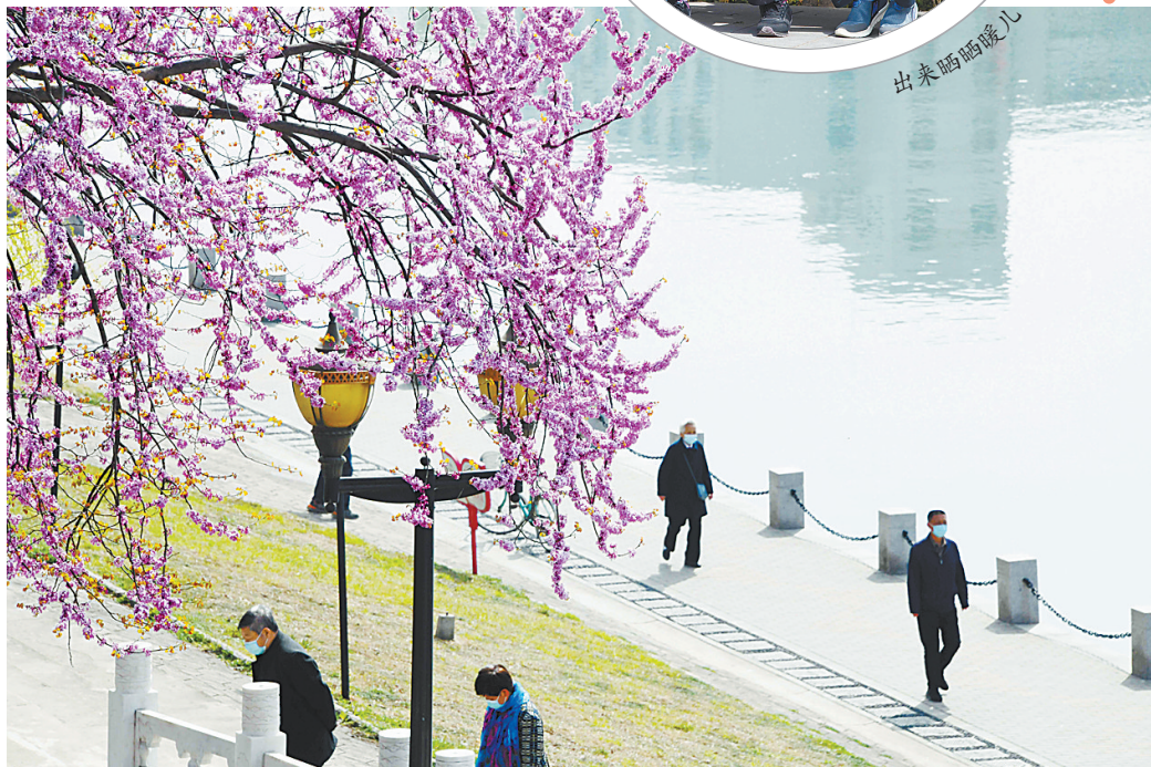
春暖花开,市民在湛河边散步