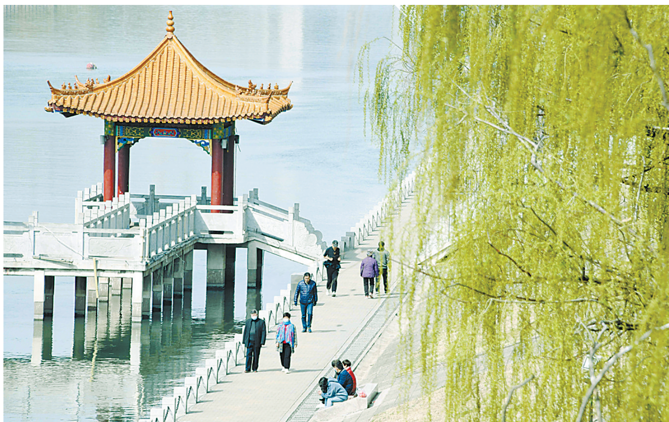
市民在河堤上 休闲健身