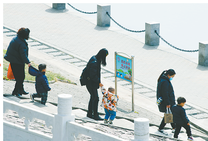
几位宝宝在下台阶