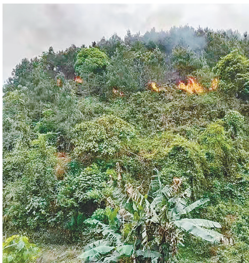
这是3月21日拍摄的藤县坠机事故现场周边画面(手机照片)