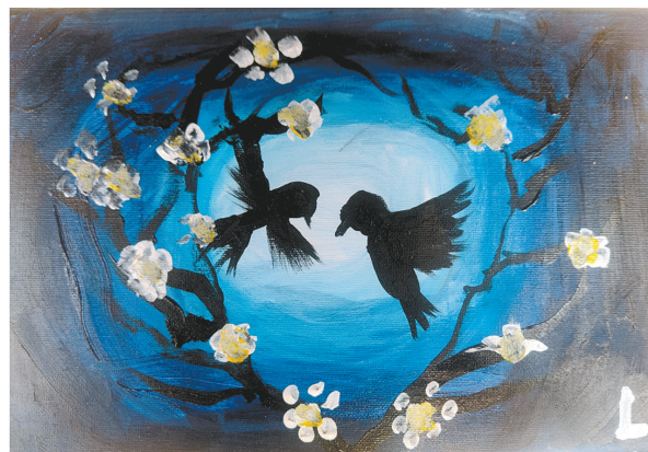
燕儿归来 东环路小学二(2)班 罗羿