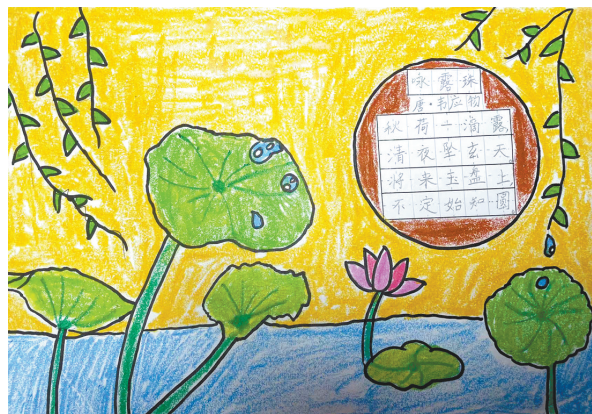
咏露珠 新华区实验小学二(5)班 周新越