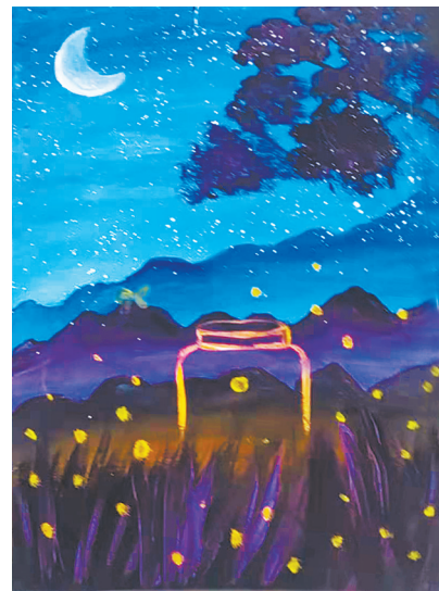
星空 东环路小学四(4)班 尹梓瑾