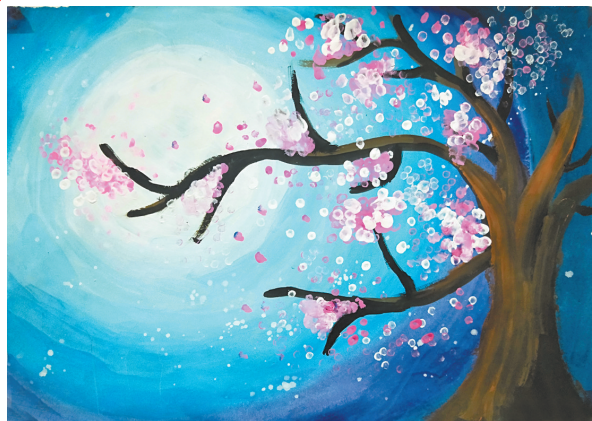
桃花开了 雷锋小学五(4)班 孙若萱 指导老师：邢爱丽