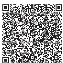
扫码下载农行掌银APP