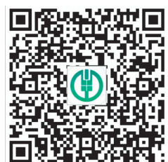
扫码进入 农行燃气费缴费中心

农行掌银自助注册流程为：扫码下载农行掌银-点击“我的账户”快捷注册-绑定身份证，设置登录密码-输入手机号码一键登录-点击我的账户添加银行卡即可支付。（胡志军 石晓燕）