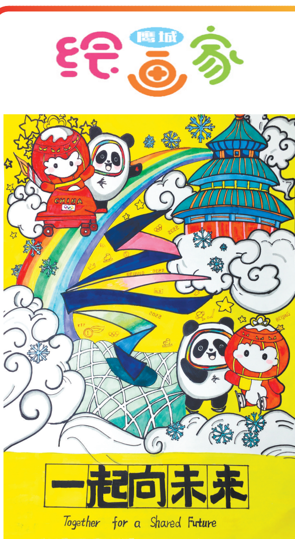
一起向未来 体育路小学一(6)班 李晨雨