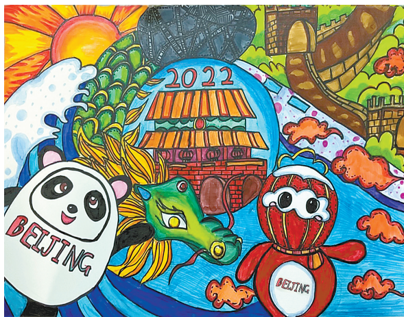
我们的冬奥 体育路小学二(7)班 邢珂宁