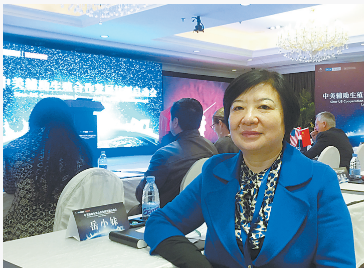
岳小妹参加中美辅助生殖合作发展计划启动会