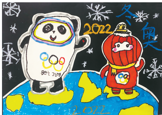
冰墩墩与雪容融 新华区实验小学二(3)班 刘景坤