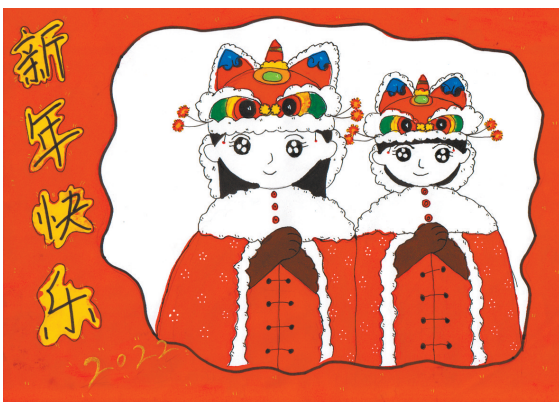
姐妹拜年 雷锋小学二(6)班 刘蕙茜