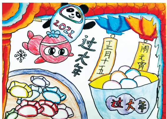
闹元宵 雷锋小学二(2)班 崔恒嘉