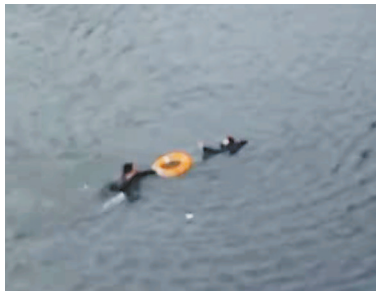
把救生圈递给落水男子