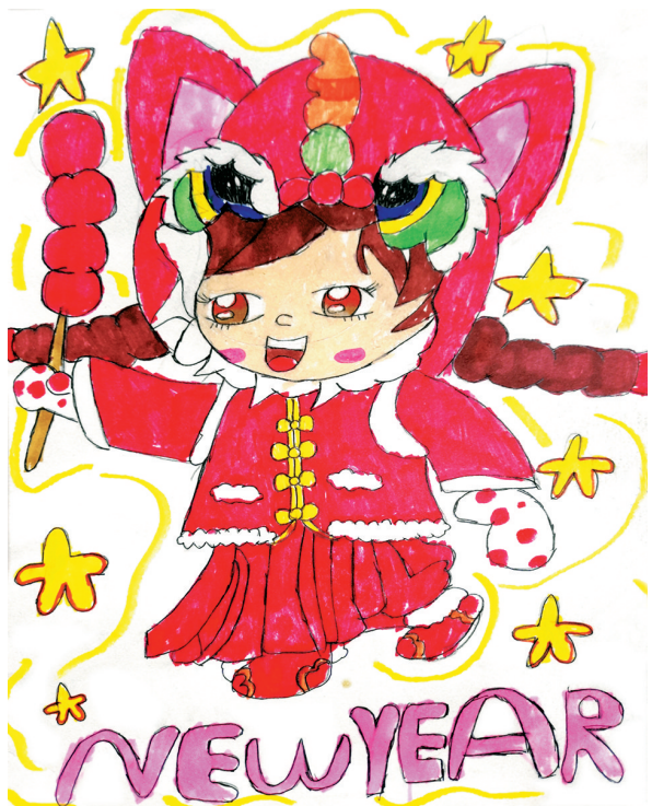
虎年大吉 胜利街小学二(5)班 陈诺莹