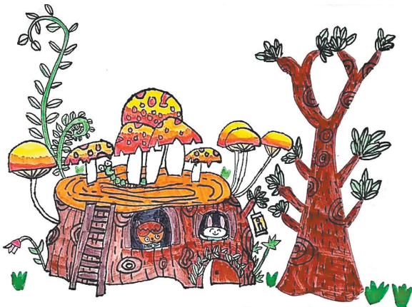
蘑菇树屋 公明路小学二(2)班 常城 (指导老师:张艳姣)