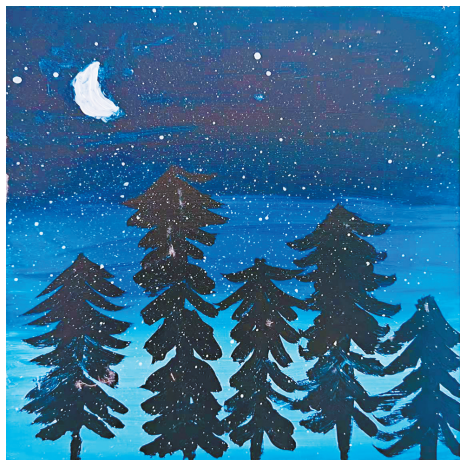
静谧的夜 雷锋小学二(8)班 于子彤