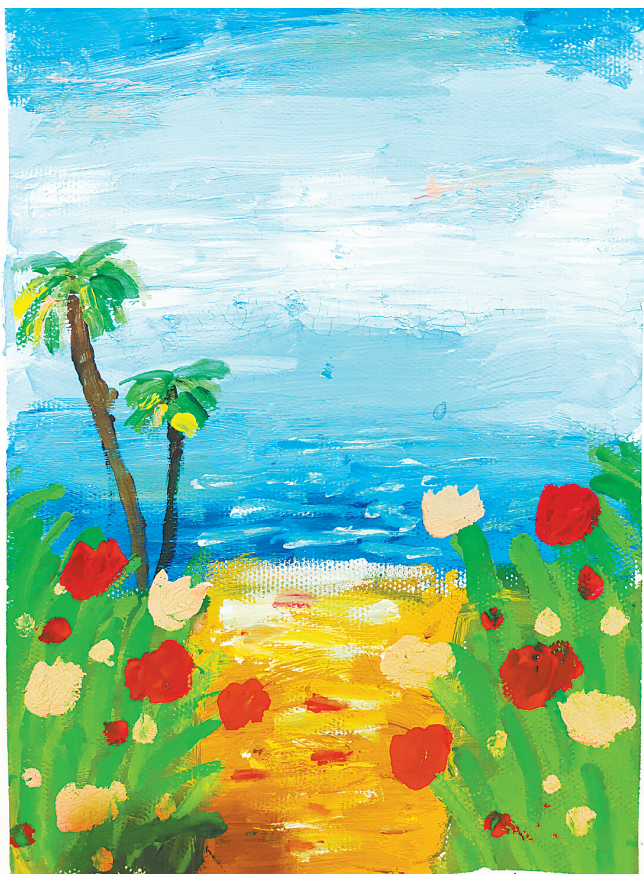
与天交界的大海 东环路小学三(4)班 朱紫娴