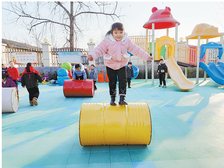
图1:孩子们在叶县洪庄杨镇第一中心幼儿园操场上玩滚桶游戏

记者从市教体局了解到,近年来,我市连续实施三期学期教育行动计划,初步形成政府主导、社会参与、公民办并举的学前教育发展格局,有效缓解“入园难”“入园贵”等问题,让孩子有园上、上好园。2021年,我市继续推进普惠发展学前教育,完成改扩建21所乡镇公办中心幼儿园建设任务。据统计,目前全市有幼儿园1246所,在园幼儿17.5万人,其中公办幼儿园325所,在园幼儿6万人,公办幼儿园在园幼儿占比34.04%,普惠性民办幼儿园608所,在园幼儿8.2万人,普惠性资源覆盖率81.04%,超出省定目标1.04个百分点。