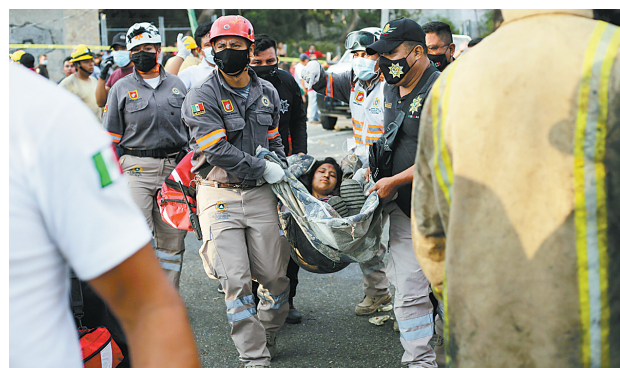
救援人员在事故现场转移伤者可能是事故原因。恰帕斯州州长鲁蒂略·

恰帕斯州民防部门负责人加西亚接受当地媒体采访时表示,当天下午3时30分左右,该州一辆载有上百名危地马拉等中美洲国家移民的卡车在经过弯道时失控翻倒,撞向路边的挡土墙,造成至少49人死亡、58人受伤,伤者已被送往附近多家医院救治。刹车失灵等机械故障