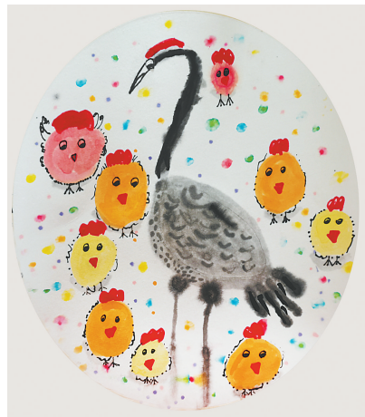
鹤立鸡群 新新街小学二(1)班 张清怡 (指导老师:王军保)