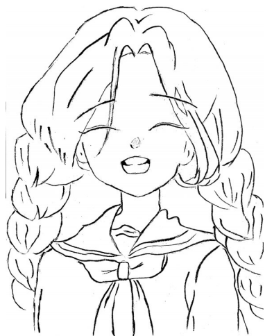
微笑女孩 湛河区实验小学三(2)班 裴紫含