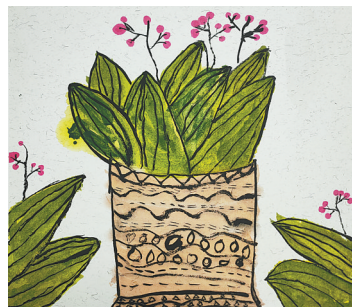
万年青 新鹰小学三(1)班 郭子源