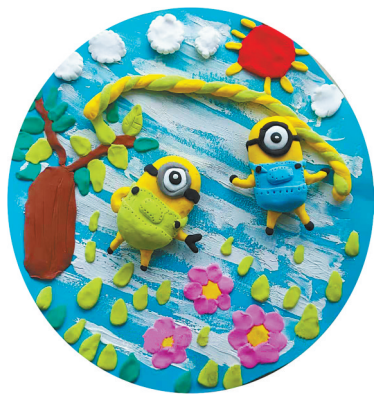
小黄人 建设街小学二(2)班 张霖轩