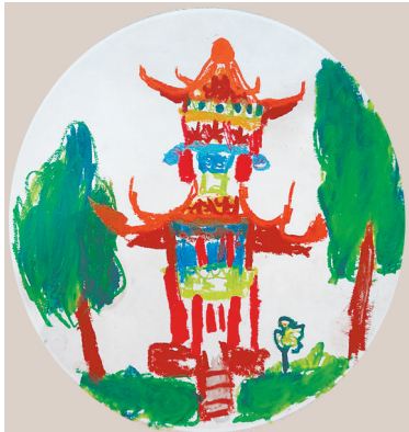
碧水亭 新华路小学二(7)班 刘语晨