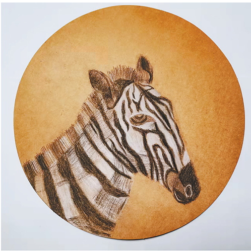
斑马 湖光小学 四(3)班 周诗雯