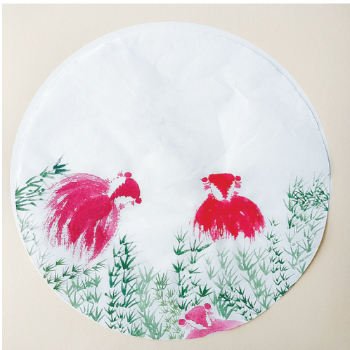
鱼戏 公明路小学 四(1)班 毛子莹