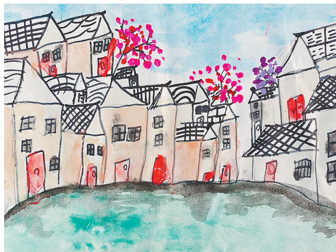
水乡 公明路小学 三(4)班 赵晨羽