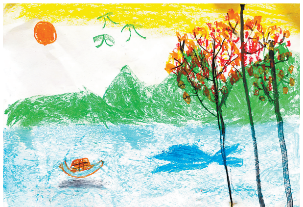
秋 雷锋小学三(6)班 沈靖喆