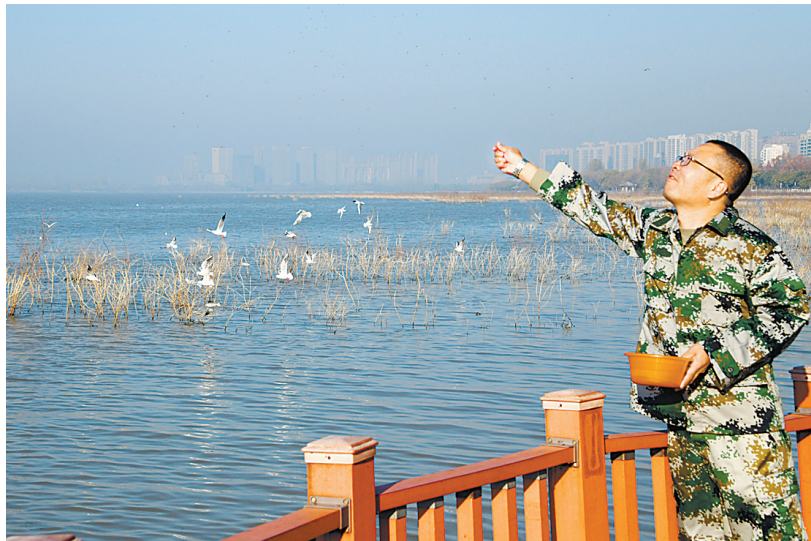
湿地巡护员投喂红嘴鸥