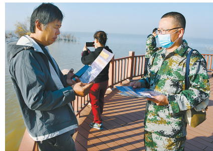
湿地巡护员发放传单,倡导文明观鸟