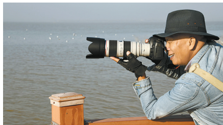
摄影爱好者拍摄鸟儿