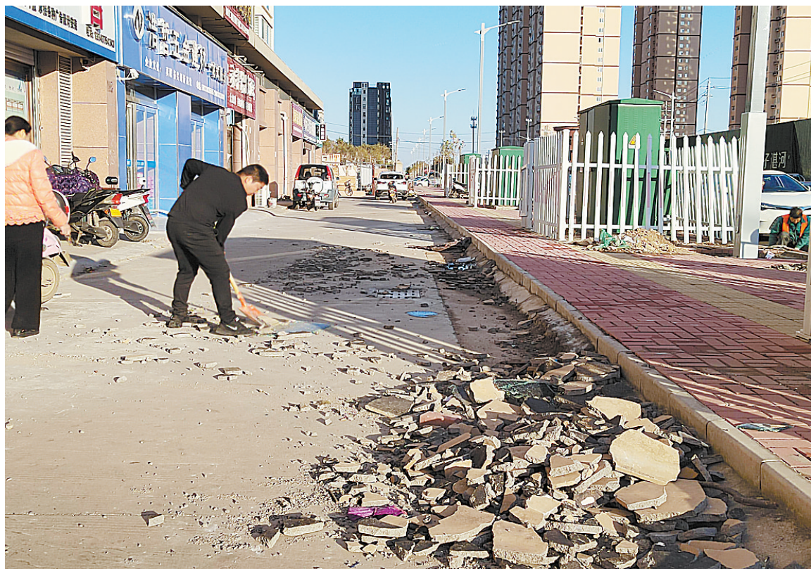
一个业主正在清理掉落的墙皮和水泥块