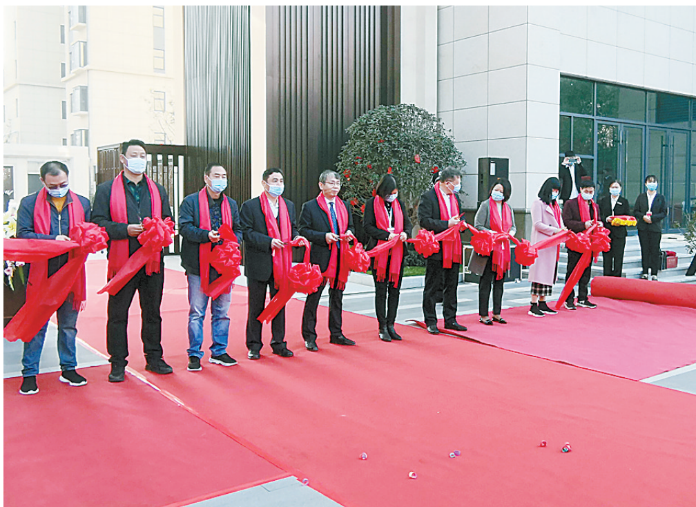
10月30日上午,荣邦花园二期二批16号、17号楼交房仪式举行,华诚荣邦集团有关负责人、怡景物业有关负责人以及部分业主为交房仪式剪彩。

在场的华诚荣邦集团负责人和怡景物业负责人均表示,交付不是结束,而是新生活的开始;怡景物业将谨记每一个承诺,以不变的初心,为业主提供最好的服务。