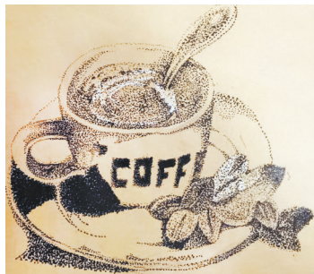
咖啡 建东小学三(4)班 杜淑伊 (指导老师:张煜帆)