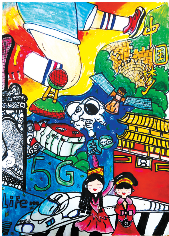
中国梦,我的梦 新程街小学四(4)班 姚姝瑜 (指导老师:胡春华)