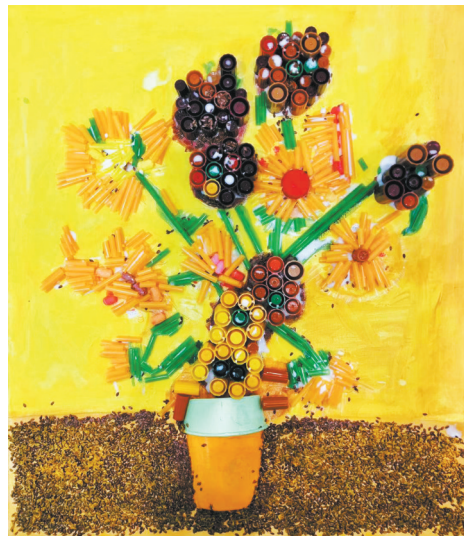
手工画 湖光小学四(4)班 朱家祺