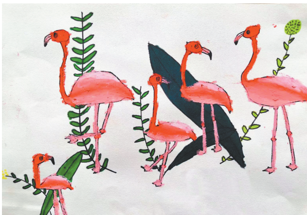
火烈鸟 湖光小学二(4)班 全芷阅