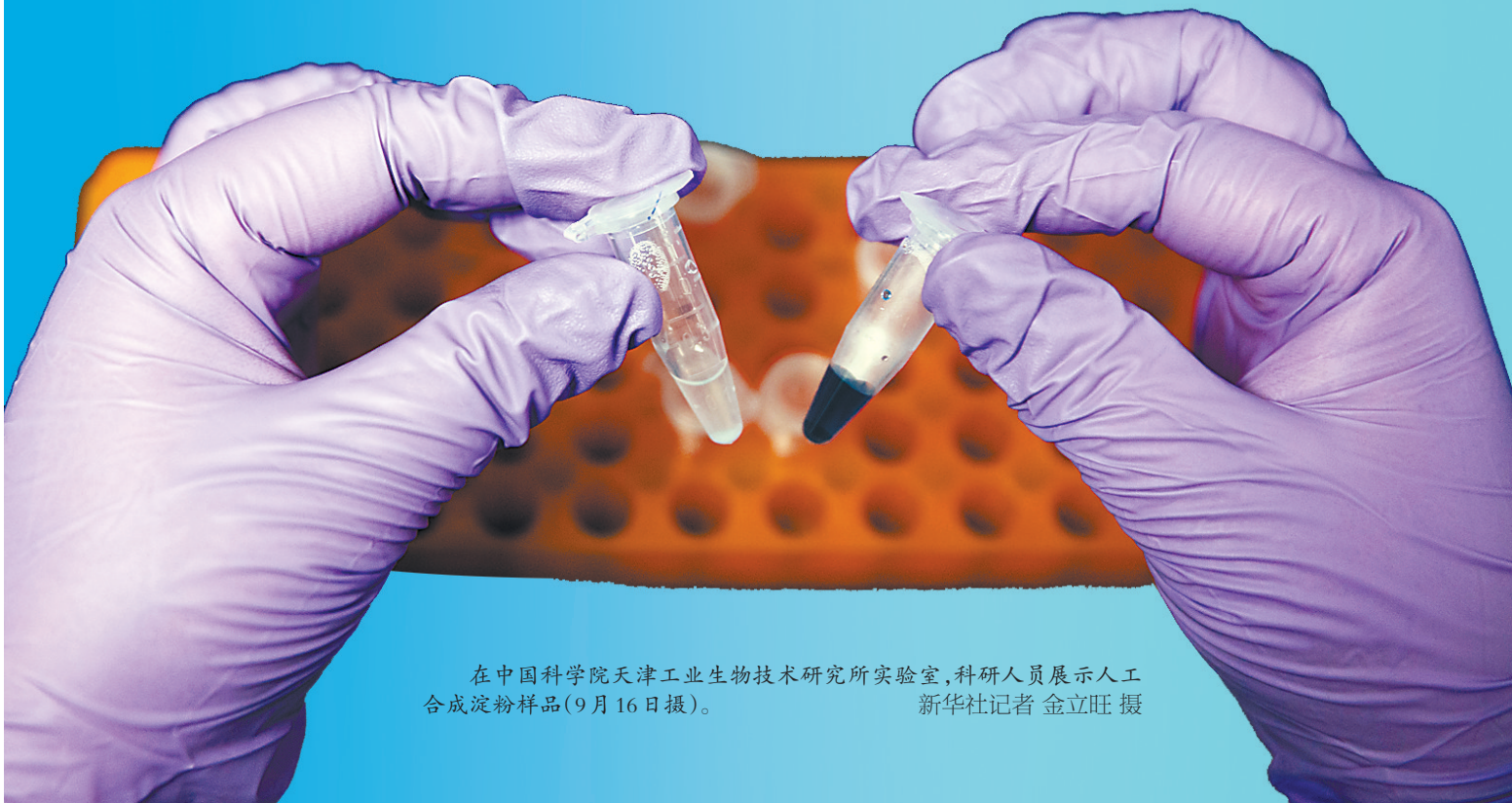
在中国科学院天津工业生物技术研究所实验室,科研人员展示人工合成淀粉样品(9月16日摄)。