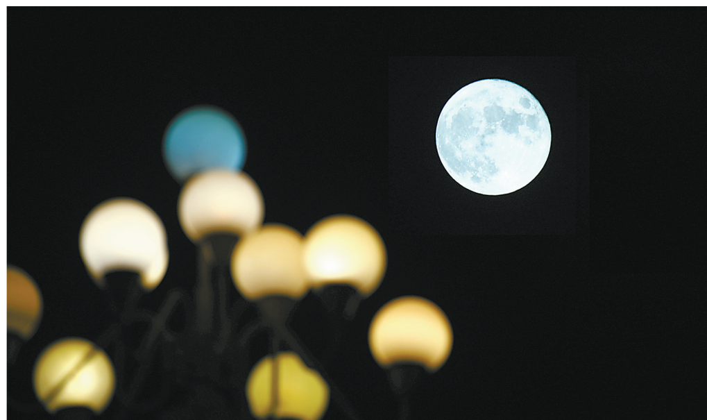
华灯和明月