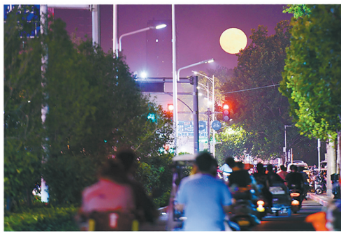
市区建设路中段，明月伴人们回家