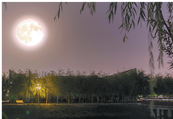
白鹭洲国家城市湿地公园