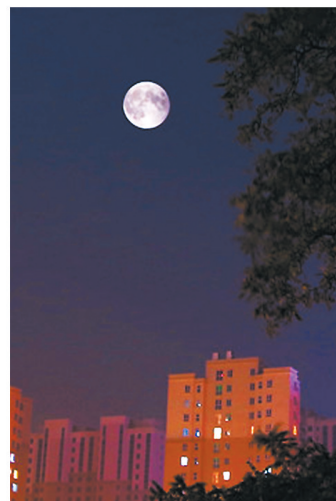
市区凌云路一住宅区上空明月高挂