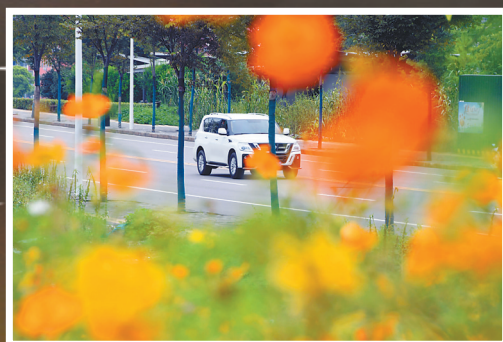
• 鲜花扮靓市区湛南路