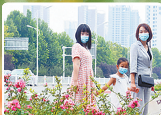
• 市城乡一体化示范区长安大道路口处，蔷薇花吸引路人目光。