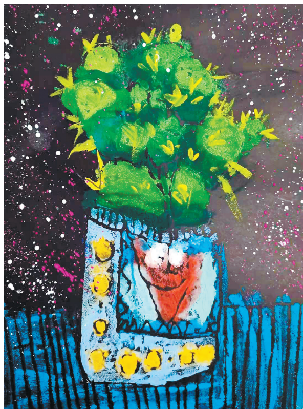
仙人掌 新华路小学二(7)班 刘语晨