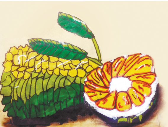
菠萝蜜 新程街小学一(3)班 朱家钰