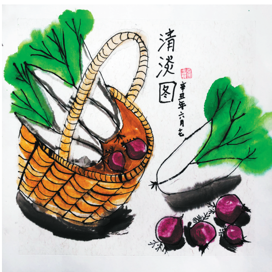
清淡图 雷锋小学二(八)班 李蕊