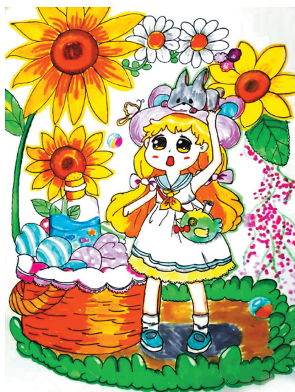
动漫人物 平马路小学五(三)班 田馨悦