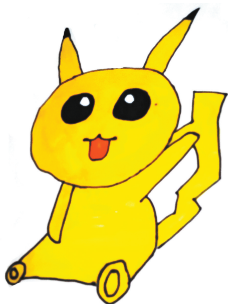
皮卡丘 韦伦双语学校四(三)班 张懿萱