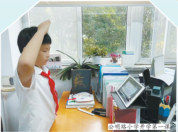
公明路小学开学第一课