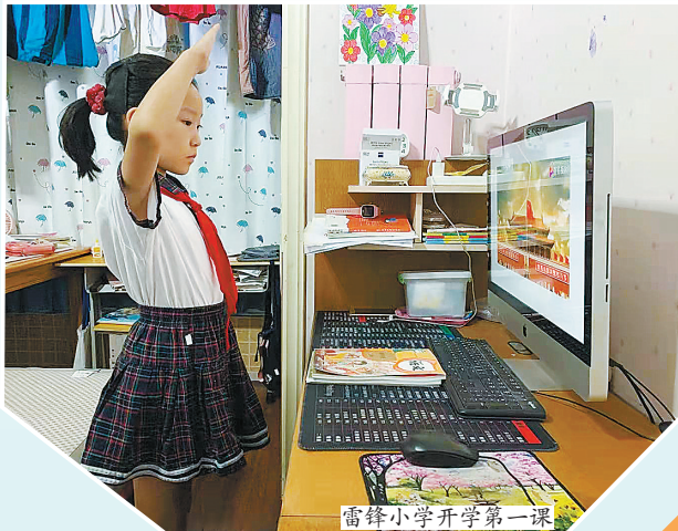
雷锋小学开学第一课