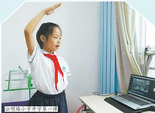
公明路小学开学第一课