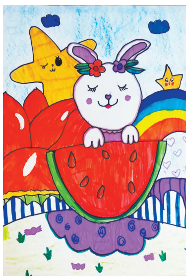
晚安，兔宝宝 一(6)班 王雯笛