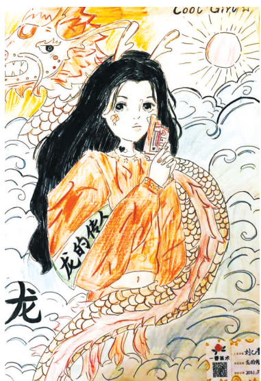
龙的传人 五(1)班 刘乙莹 (指导老师：雒玲丽)